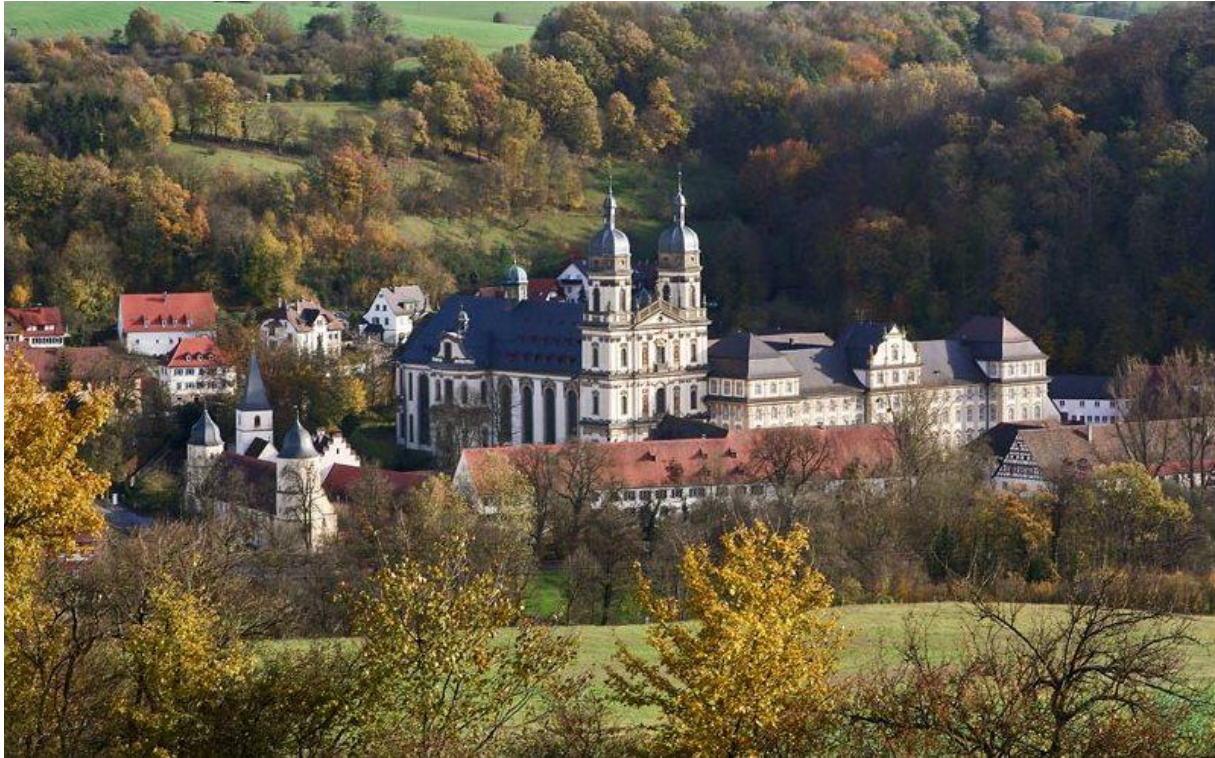
Kloster Schöntal im hohenlohischen Jagsttal (Nordwürttemberg)